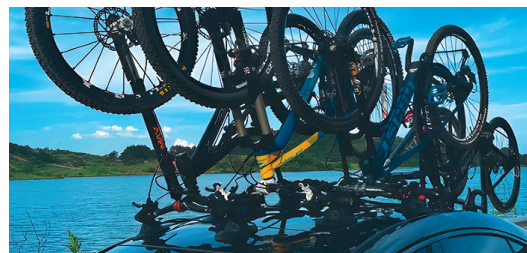
Возможность расширения системы для перевозки нескольких велосипедов