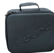
Компактный кейс для хранения