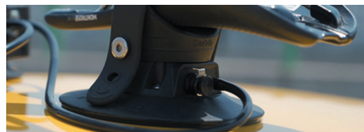
3 вакуумные присоски