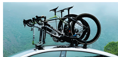
Возможность перевозки до 3-х велосипедов