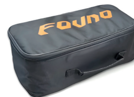
Компактный кейс для хранения