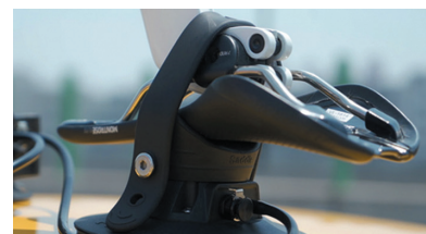
3 вакуумные присоски