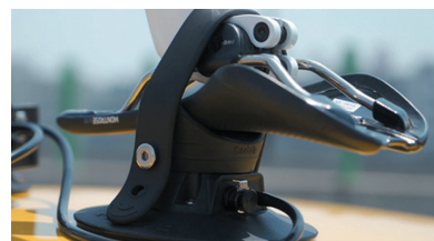
6 вакуумных присосок