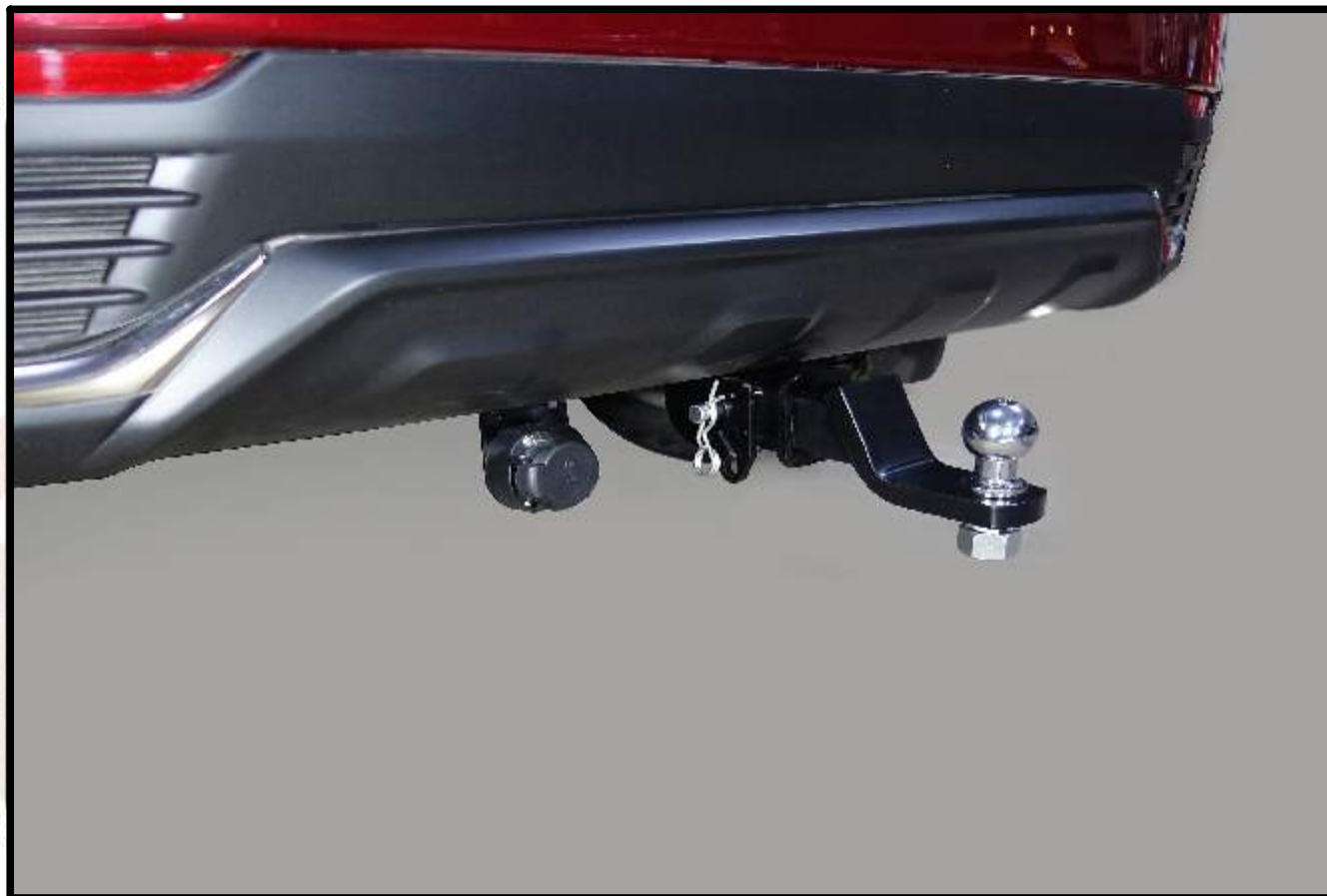
Фаркоп арт. TCU00109 TCU00109N*

TCU00109N* - обозначение комплектации фаркопа с нержавеющей шаром