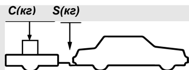
верное размещение груза